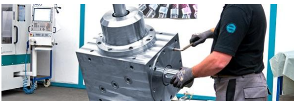
Passfedernut, Keil- oder Zahnwelle oder Schrupfscheibe